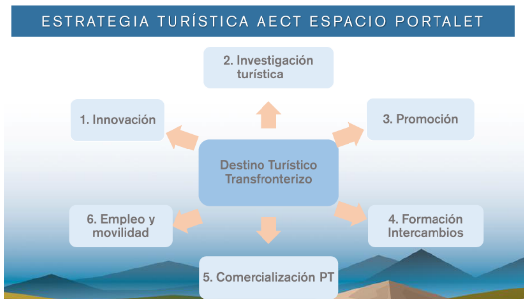
Figura 1: Misiones AECT Espacio Portalet

Para conseguir sus objetivos, se presentó el proyecto INTURPYR a la primera convocatoria del programa INTERREG-V-A España-Francia-Andorra (POCTEFA 2014-2020), proyecto europeo de cooperación territorial creado para