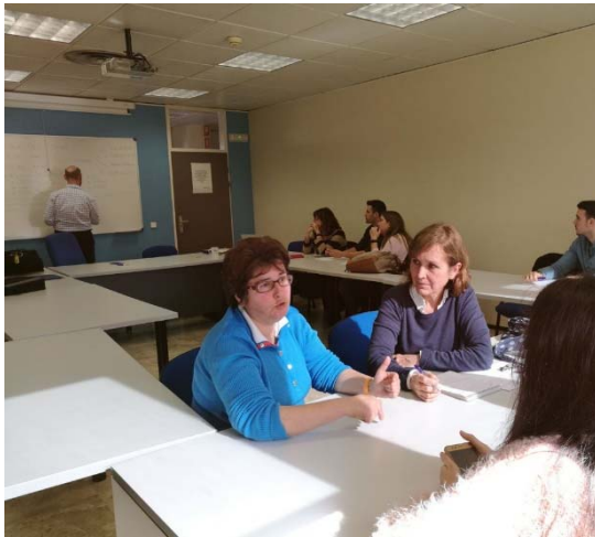
Figura 2. Reunión de trabajo para preparar la 3ª edición de Tallertur