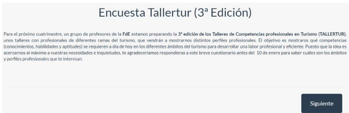
Figura 1. Pantalla inicial de la Encuesta de Tallertur

Identificadas las temáticas más valoradas y los perfiles profesionales asociados, se seleccionan seis estudiantes en prácticas extracurriculares y se dividen a estos en tres grupos de trabajo con dos tutores-profesores. Los grupos de trabajo en la organización de Tallertur son: