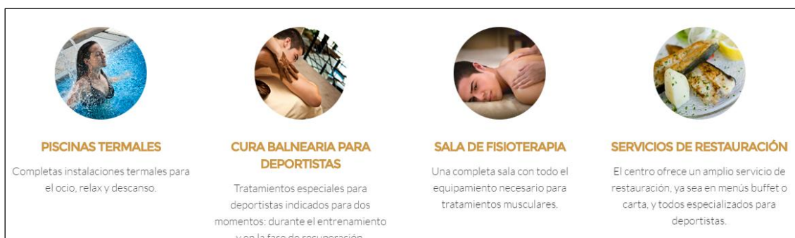
Figura 4. Servicios ofertados en los centros de entrenamiento del grupo Caldaria